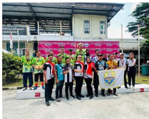
Gambar 4. Foto bersama pengurus fopi kota cimahi fopi jambi dan team dari tailand