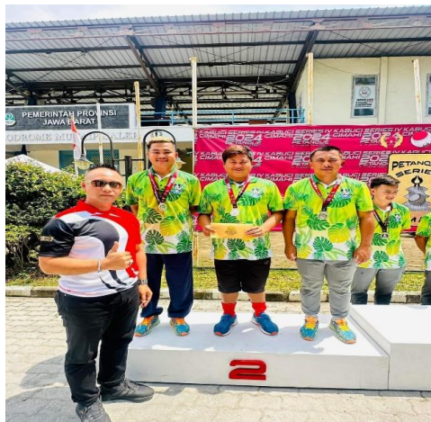
Gambar 3. Pembagian Hadiah Sang Juara