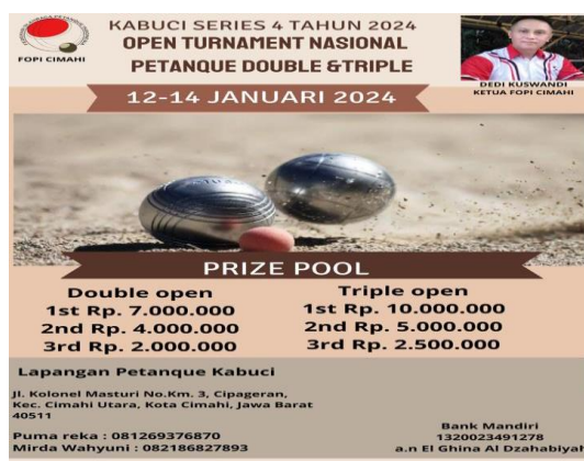
Gambar 1. Brosur Kejuaraan Kabuci Series 4 Tahun 2024 Open Tournament Nasional Petanque Double Dan Triple