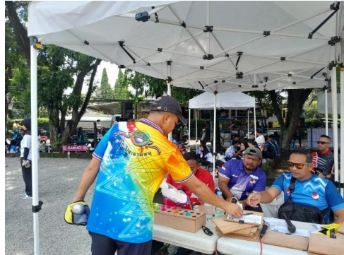
Gambar 2. Pelaksaaan Kejuaraan Bandung Pétanque Open Tahun 2023